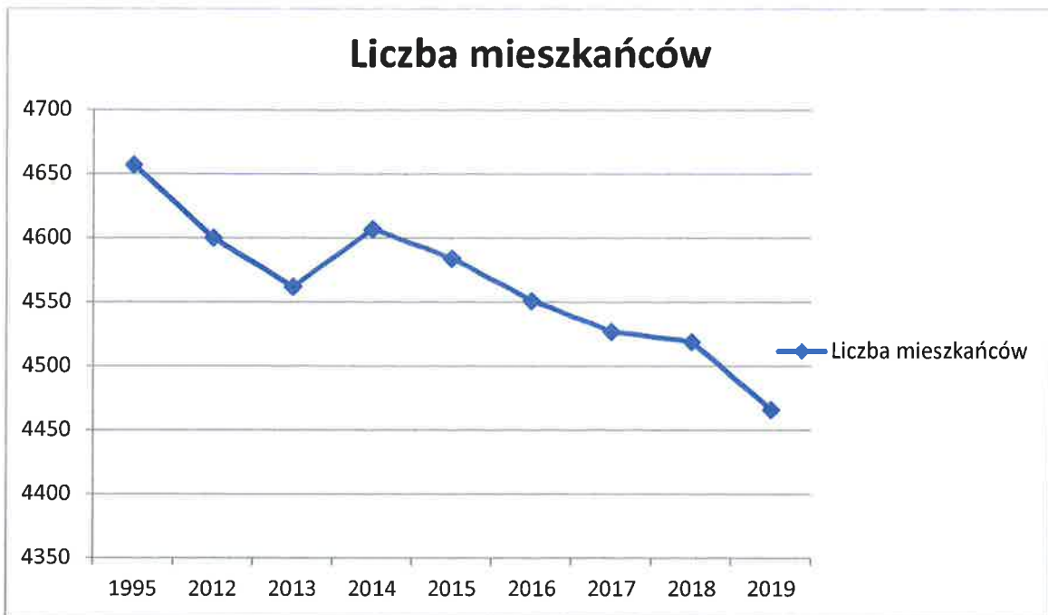
Wykres 1. Liczba mieszkańców Gminy Paradyż

Powyższy wykres przedstawia liczbę mieszkańców gminy w ostatnich latach w porównaniu do roku 1995 r., ponieważ rok 1995 jest rokiem bazowym przy obliczaniu poziomów recyklingu. Liczba mieszkańców w ostatnim okresie w porównaniu do roku 1995 maleje.