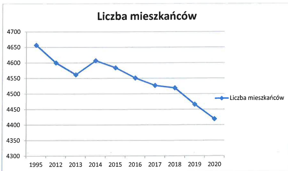
Wykres 1. Liczba mieszkańców Gminy Paradyż

Powyższy wykres przedstawia liczbę mieszkańców gminy w ostatnich latach w porównaniu do roku 1995 r., ponieważ rok 1995 jest rokiem bazowym przy obliczaniu poziomów recyklingu. Liczba mieszkańców w ostatnim okresie w porównaniu do roku 1995 maleje.