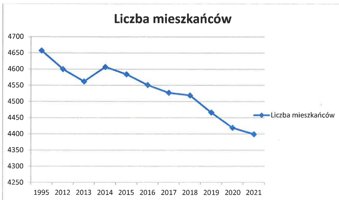
Wykres 1. Liczba mieszkańców Gminy Paradyż

Na dzień 31 grudnia 2021 roku liczba osób zameldowanych na terenie Gminy Paradyż wyniosła 4399 (według danych z Ewidencji Ludności Urzędu Gminy Paradyż), natomiast liczba mieszkańców gminy na podstawie danych pochodzących ze złożonych przez właścicieli nieruchomości deklaracji o wysokości opłat za gospodarowanie odpadami komunalnymi wyniosła 3725.