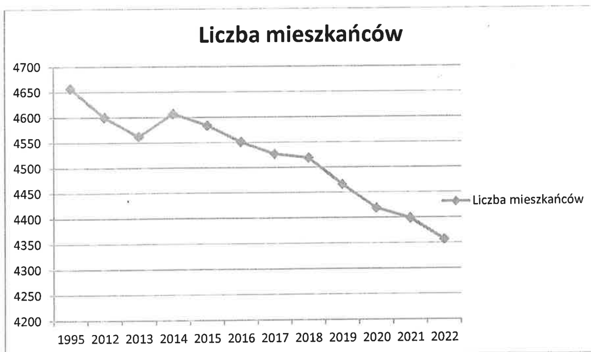
Wykres 1. Liczba mieszkańców Gminy Paradyż