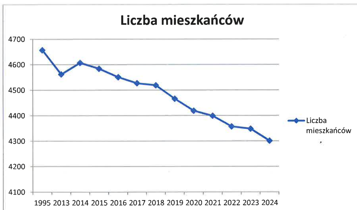
Wykres 1. Liczba mieszkańców Gminy Paradyż

Na dzień 31 grudnia 2024 roku liczba osób zameldowanych na terenie Gminy Paradyż wyniosła 4301 (według danych z Ewidencji Ludności Urzędu Gminy Paradyż), natomiast liczba mieszkańców gminy na podstawie danych pochodzących ze złożonych przez właścicieli nieruchomości deklaracji o wysokości opłat za gospodarowanie odpadami komunalnymi wyniosła 3631. Udział liczby mieszkańców według złożonych deklaracji do liczby mieszkańców według ewidencji ludności wynosi 84,42%.